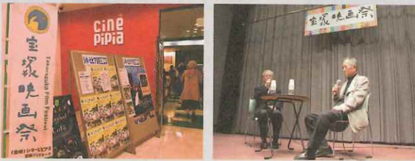
過去の宝塚映画祭の様子

時を経て「宝塚にもう一度映画の灯をともしたい」と、同じ思いを持つ主婦、学生、会社員など有志が集い、宝塚映画祭実行委員会が発足した。